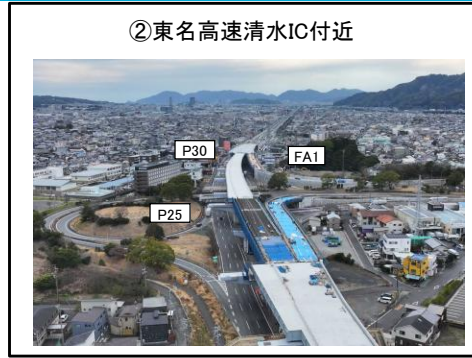
②東名高速清水IC付近 FA1~P30橋脚 床版工 施工中 P25~P30橋脚 床版工 施工完了