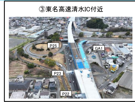
③東名高速清水IC付近 GA1~P23橋脚 床版工 施工中 P23~P25橋脚 床版工 施工中