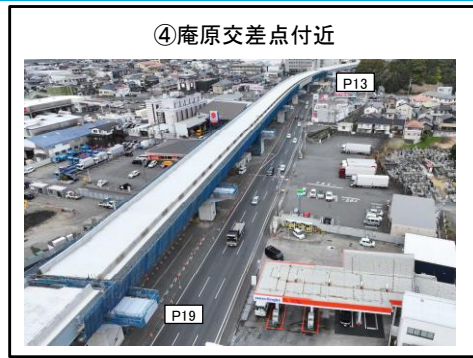
④庵原交差点付近 P13~P19橋脚 床版工 施工中