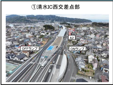
①清水IC西交差点部 A2橋台西側擁壁部 擁壁工等 施工中