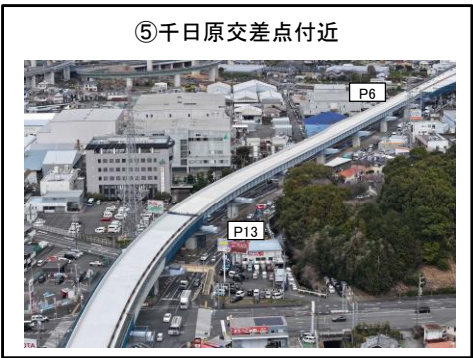
⑤千日原交差点付近