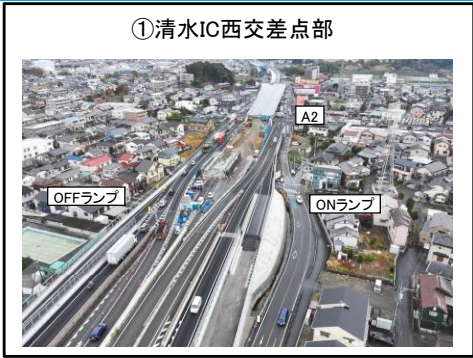
①清水IC西交差点部 A2橋台西側擁壁部 擁壁工 施工中