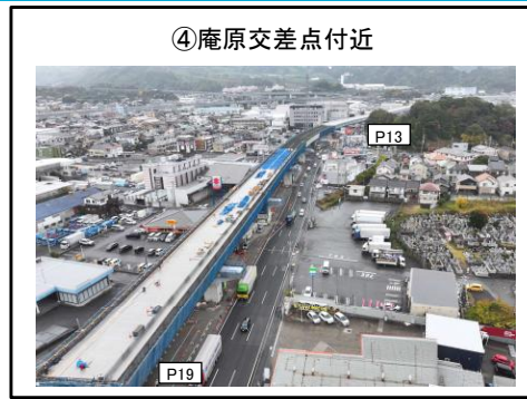
④庵原交差点付近 P13～P19橋脚 床版工 施工中