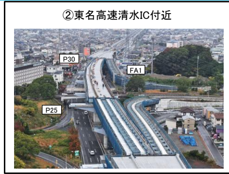
②東名高速清水IC付近 FA1～P30橋脚 床版工 施工中 P25～P30橋脚 床版工 施工中