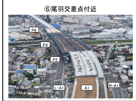
⑥尾羽交差点付近 P2橋脚～P6橋脚 床版工 施工中 A1橋台～P2橋脚 床版工 施工中