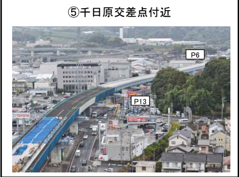
⑤千日原交差点付近