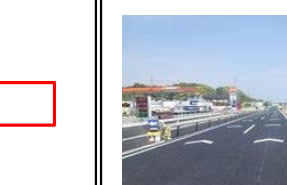
上り線横砂地区車線切替完了

施工会社：日本道路(株) 工期：令和2年6月30日まで 工事状況：4月21日に上り線の車線切替が完了しました。今後は横砂北交差点内及び上り線側の切削オーバレイを行います。