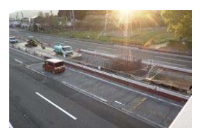
P27橋脚躯体施工状況

施工会社：五光建設(株) 工期：令和2年7月30日まで 工事状況：P27橋脚の底版部の施工を行っています。