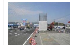
P19 覆工板撤去仮舗装完了

施工会社：木内建設(株) 工期：令和2年6月30日まで 工事状況：P19橋脚は完了し、今後は、P20橋脚の埋戻し・覆工板撤去を行います。