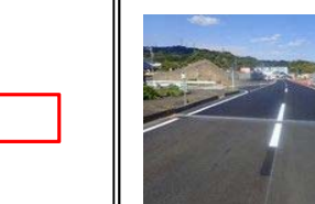
上り線尾羽地区車線切替完了

施工会社：鈴与建設(株) 工期：令和2年6月30日まで 工事状況：4月21日に上り線の車線切替が完了しました。5月から尾羽交差点内の歩道橋撤去・舗装を、上下線の右折レーンを開始して行っています。