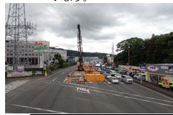
鋼管杭施工状況：P13橋脚

施工会社：木内建設(株) 工期：令和2年1月10日 工事状況：夜間、鋼管杭を施工して います。