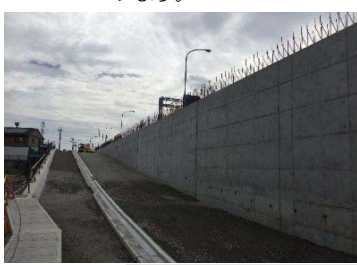
上り線 副道 施工状況

施工会社：平井工業(株) 工期：令和元年12月20日 工事状況：上り線副道を整備して います。