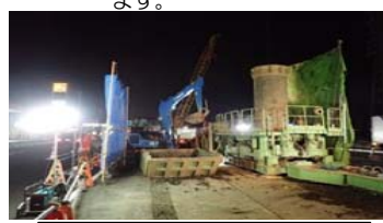
場所打ち杭施工状況：P18橋脚

施工会社：木内建設(株) 工期：令和2年1月10日 工事状況：夜間、鋼矢板の打込み、 場所打ち杭を施工してい ます。