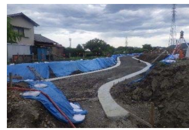
排水構造物 施工状況

施工会社：静和工業(株) 工期：令和元年12月27日 工事状況：排水構造物を施工しています。