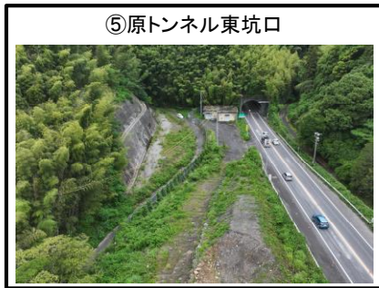
⑤原トンネル東坑口