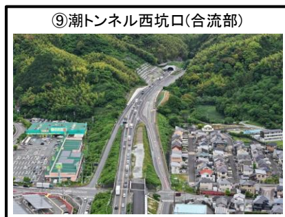
⑨潮トンネル西坑口 (合流部)