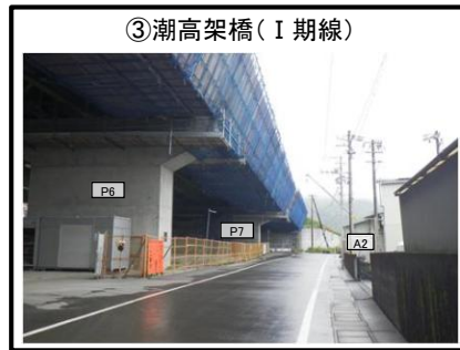
③潮高架橋 (I 期線)