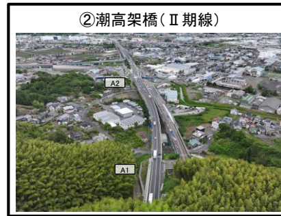
②潮高架橋 (II 期線)