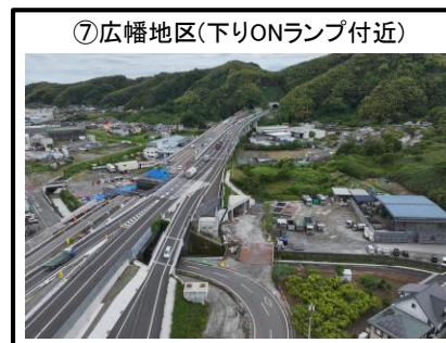
⑦広幡地区 (下りONランプ付近)