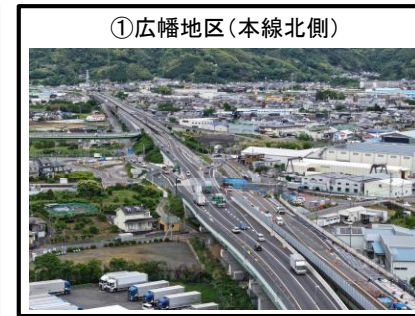
①広幡地区 (本線北側)