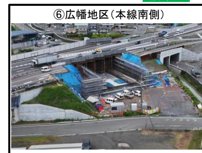
⑥広幡地区 (本線南側)