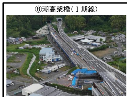
⑧潮高架橋 (I 期線)