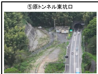
⑤原トンネル東坑口