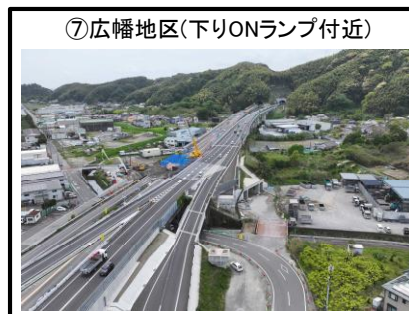
⑦広幡地区 (下りONランプ付近)