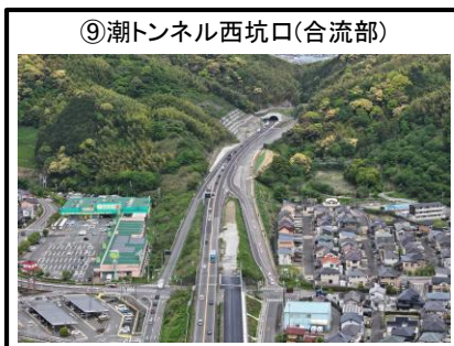
⑨潮トンネル西坑口 (合流部)