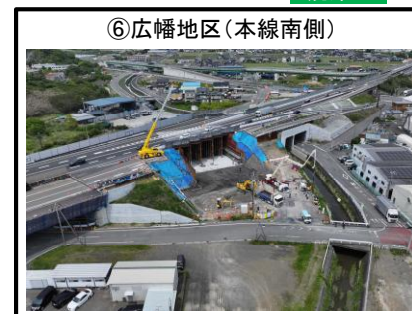
⑥広幡地区 (本線南側)