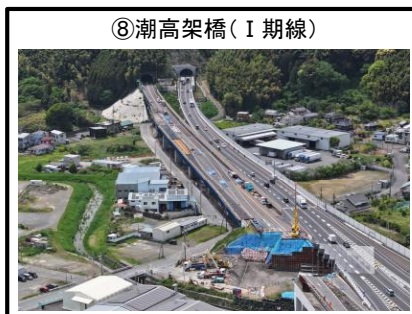
⑧潮高架橋 (I 期線)