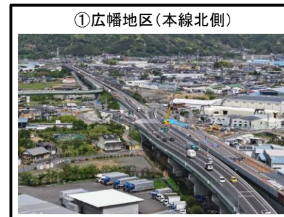
①広幡地区 (本線北側)