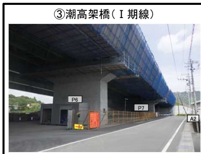
③潮高架橋 (I 期線)