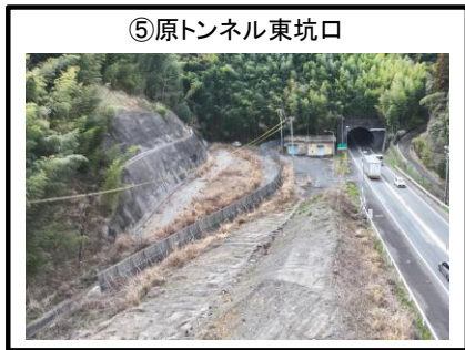
⑤原トンネル東坑口