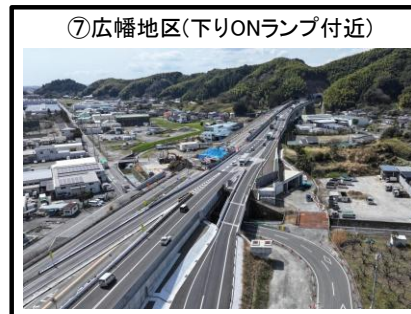
⑦広幡地区 (下りONランプ付近)