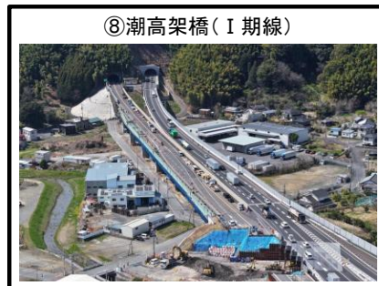
⑧潮高架橋 (I 期線)