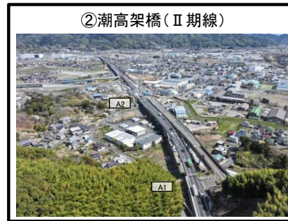
②潮高架橋 (II 期線)