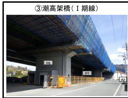
③潮高架橋 (I 期線)