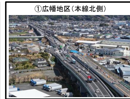
①広幡地区 (本線北側)