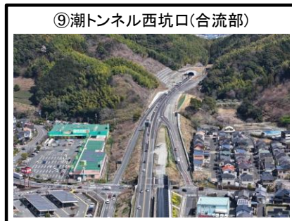
⑨潮トンネル西坑口 (合流部)