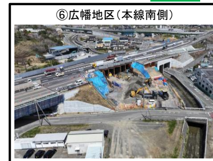
⑥広幡地区 (本線南側)