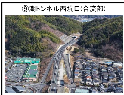
⑨潮トンネル西坑口(合流部)