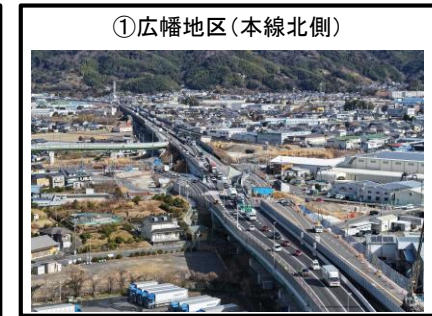
①広幡地区（本線北側）