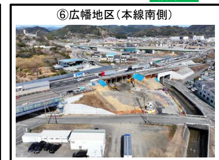
⑥広幡地区（本線南側）