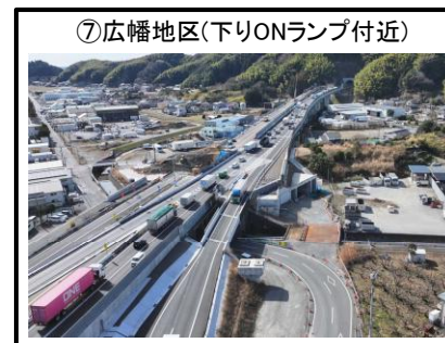
⑦広幡地区(下りONランプ付近)