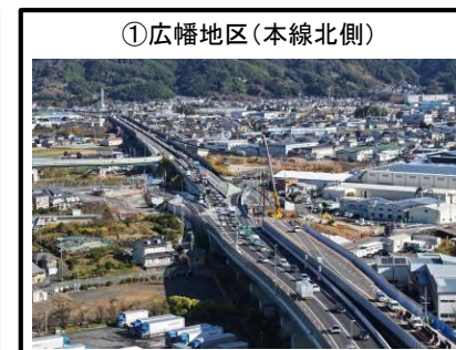
①広幡地区（本線北側）