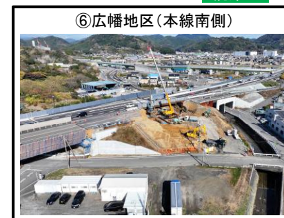
⑥広幡地区（本線南側）