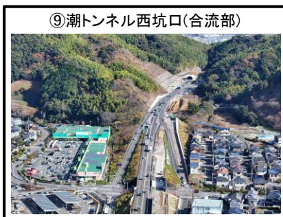
⑨潮トンネル西坑口(合流部)