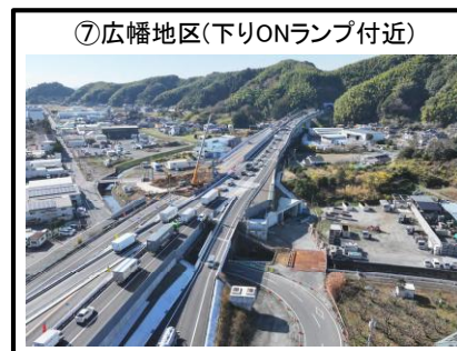
⑦広幡地区(下りONランプ付近)