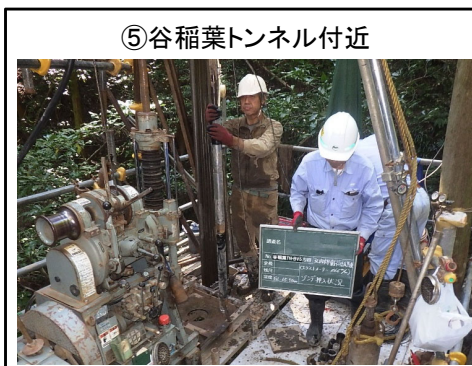
⑤谷稲葉トンネル付近 孔内水平載荷試験実施状況