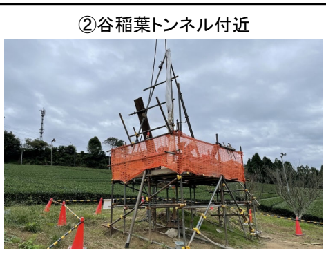
②谷稲葉トンネル付近 鉛直ボーリング実施状況