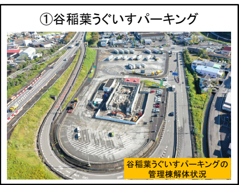
管理棟解体施工中