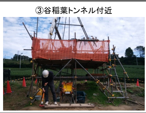
③谷稲葉トンネル付近 PS検層 P波起震状況