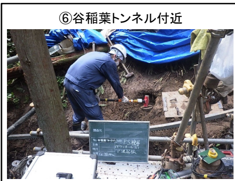
⑥谷稲葉トンネル付近 PS検層 P波起震状況