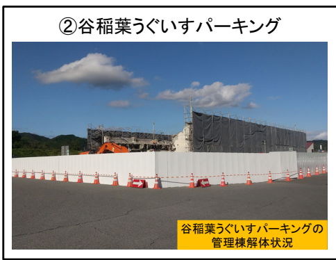
管理棟解体施工中