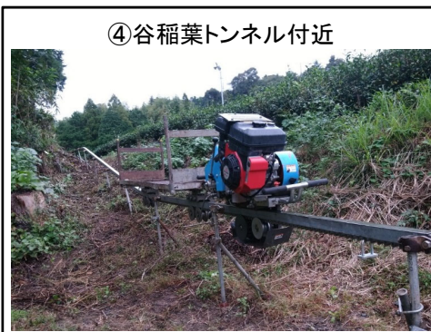
④谷稲葉トンネル付近 モノレール設置状況