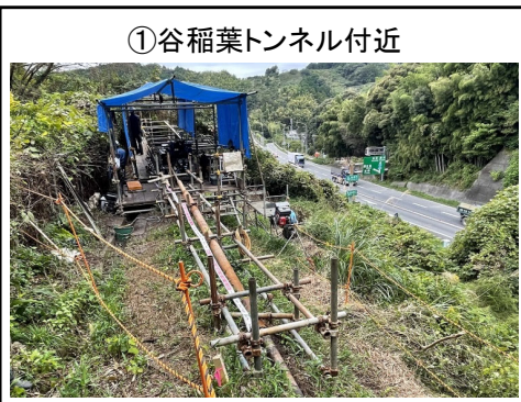
①谷稲葉トンネル付近 水平ボーリング実施状況