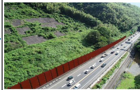
12月上旬～着手予定 (藤枝BP集中工事と同調)