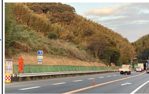
ネットフェンス設置