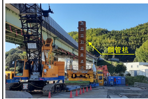
P5橋脚の鋼管杭施工状況