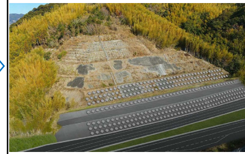
工事完成イメージ