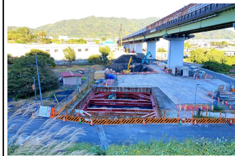
P1橋脚の床堀施工状況