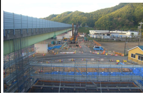
橋台1基・橋脚5基の施工状況