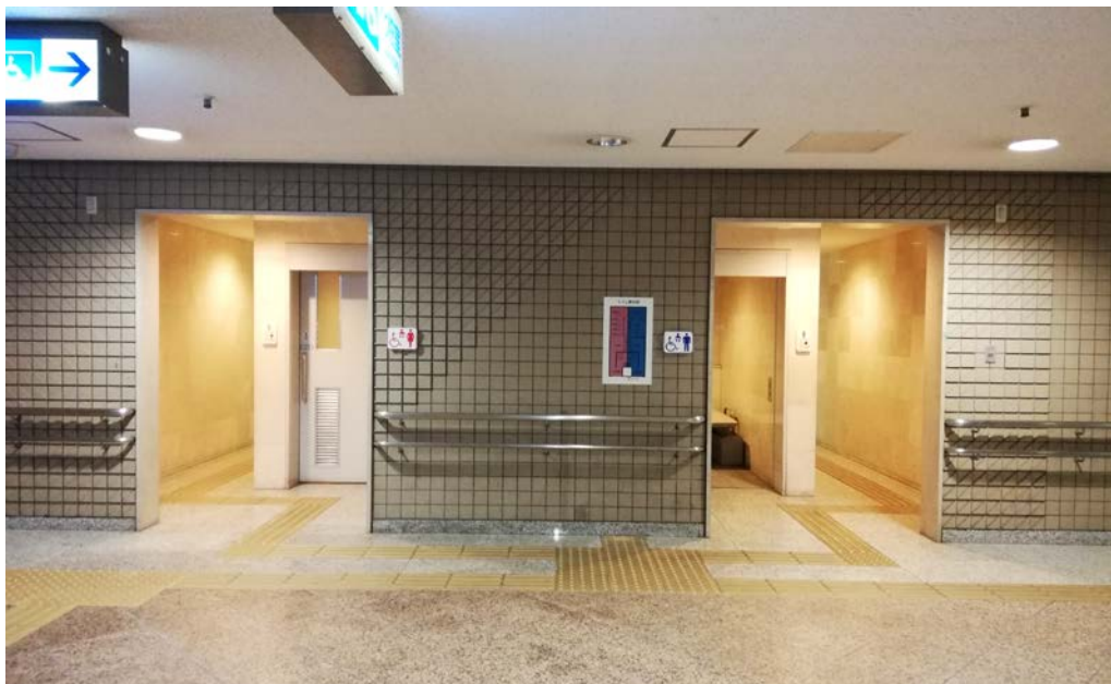
エキパトイレ 正面