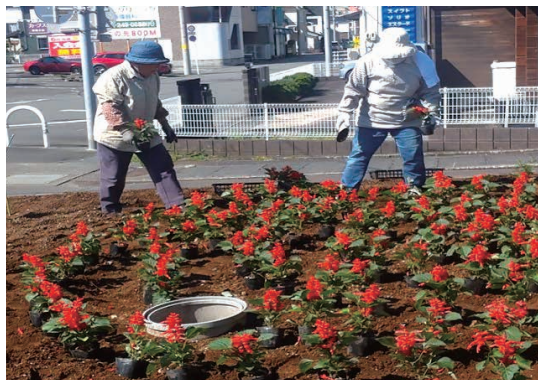
大岩四丁目町内会