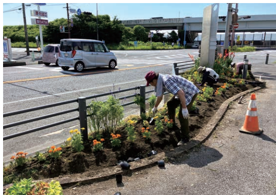
興津まちづくり推進委員会