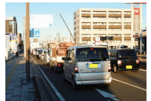
長沼交差点周辺渋滞の様子