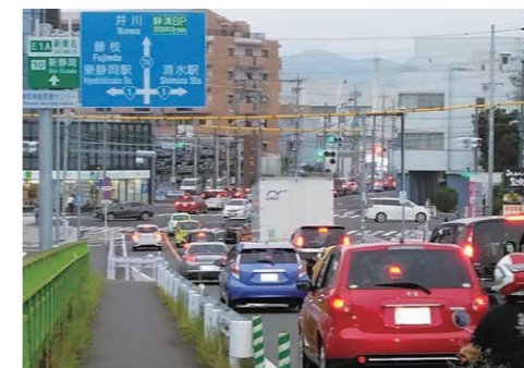
長沼大橋渋滞の様子