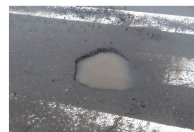
ポットホールを見つけたら…