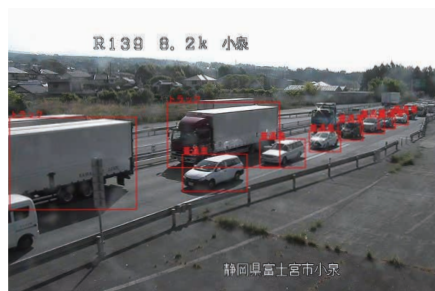
AIで渋滞状況を検知します