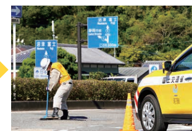
埋め戻し作業を行います！