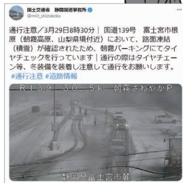
ツイッターにてリアルタイムで情報発信しています