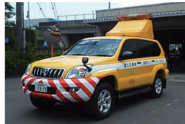
道路パトロールカー