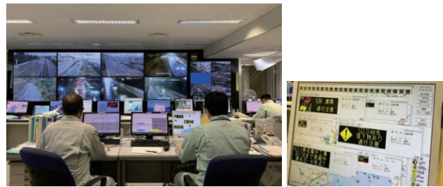
道路情報センター