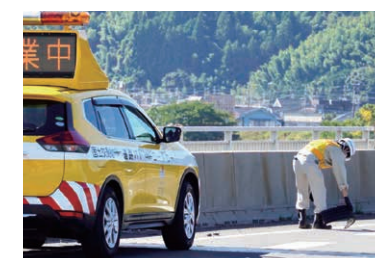
落下物回収作業の様子

道路緊急ダイヤル（#9910）への通報件数 （中部地方整備局）令和2年10月～令和3年9月