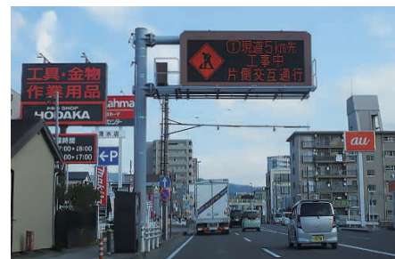
情報を元に道路情報板で工事による通行規制のご案内