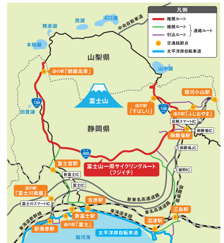
※山梨県側のルートは検討中