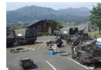
広域的な防災拠点 (イメージ)