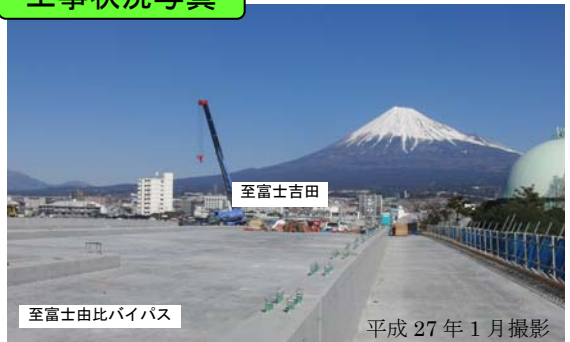
潤井川橋の床版のコンクリートを打設しました。