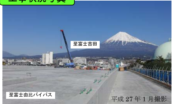
潤井川橋の床版のコンクリートを打設しました。