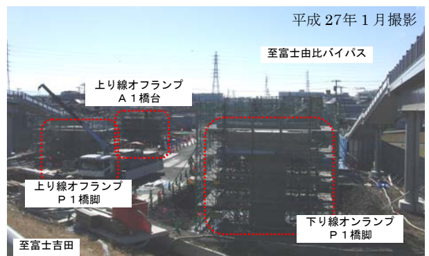
ランプ橋下部工 施工状況