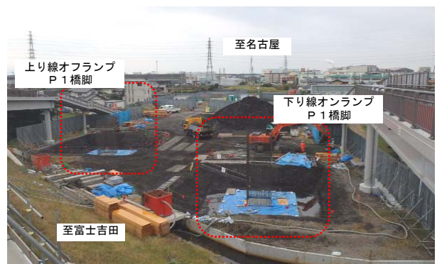
平成 26 年 10 月撮影 ランプ橋(橋脚)施工状況