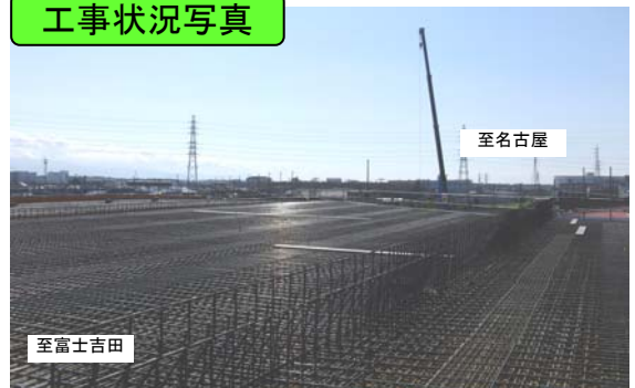
平成 26 年 10 月撮影 潤井川橋の床版鉄筋工が完了しました。