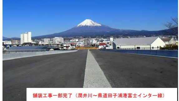
舗装工事一部完了 (潤井川～県道田子浦港富士インター線)