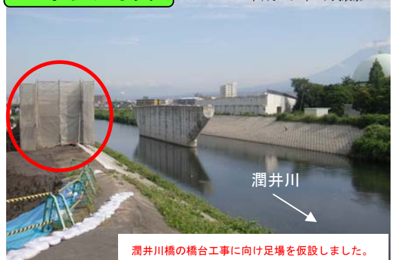
潤井川橋の橋台工事に向け足場を仮設しました。