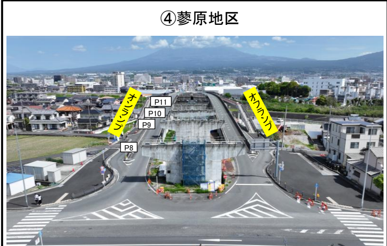
P8橋脚から北側を望む