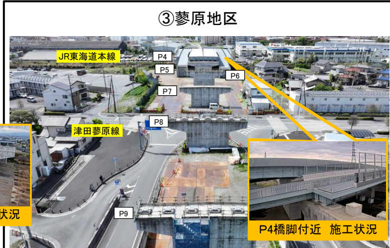
P8橋脚より南側を望む