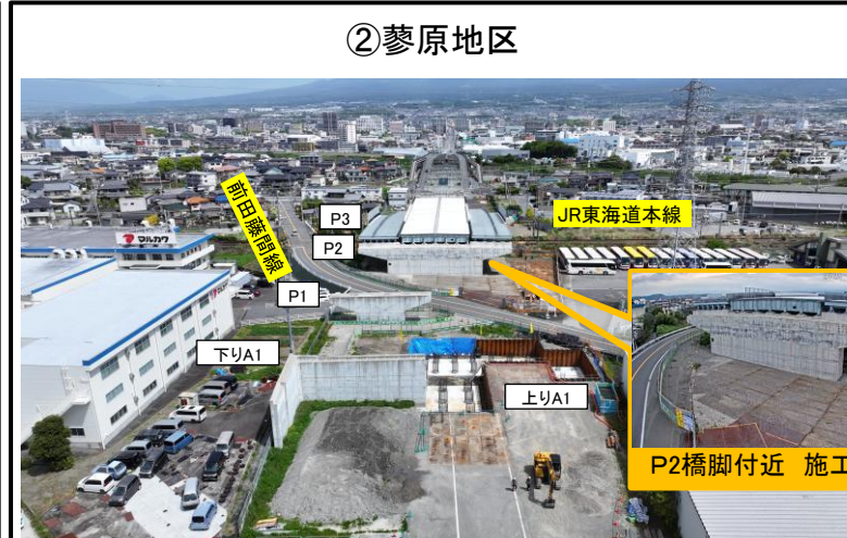
A1橋台から北側を望む