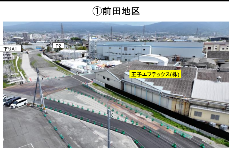
(仮称)蓼原交差点付近から北側を望む