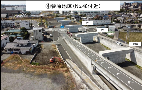
④蓼原地区(No.48付近) P8・P9・P10橋脚 令和4年2月 施工完了