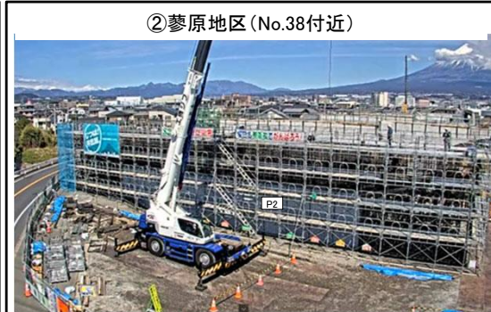
②蓼原地区(No.38付近) P2橋脚 令和5年10月着工