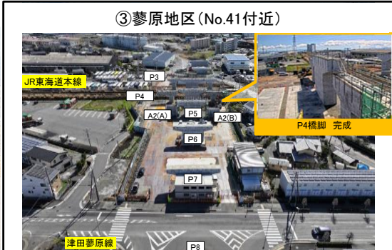
③蓼原地区(No.41付近) P4橋脚 令和6年3月 施工完了