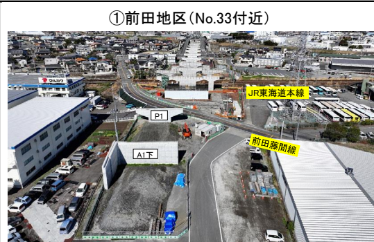
①前田地区(No.33付近) A1橋脚 下り背面L型擁壁 施工完了