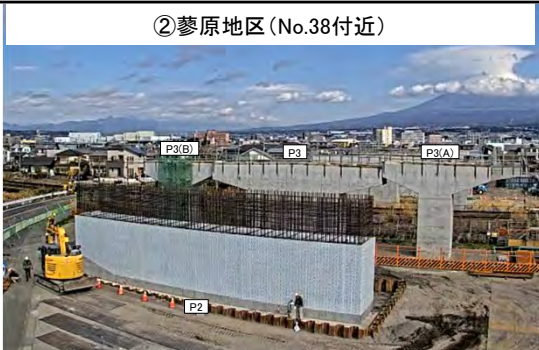
②蓼原地区 (No.38付近) P2橋脚 令和5年10月着工