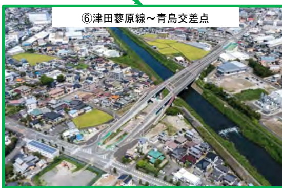
⑥津田蓼原線～青島交差点 平成28年3月供用済