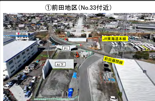
①前田地区 (No.33付近) A1橋脚 下り背面L型擁壁 施工完了