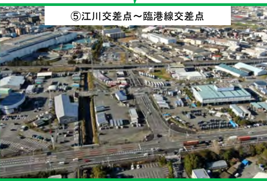
⑤江川交差点～臨港線交差点 平成20年12月供用済