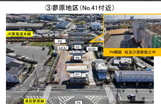
③蓼原地区 (No.41付近) P4橋脚 令和5年4月着工