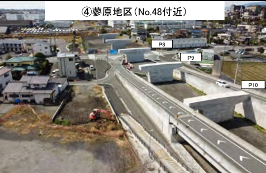
④蓼原地区 (No.48付近) P8・P9・P10橋脚 令和4年2月 施工完了