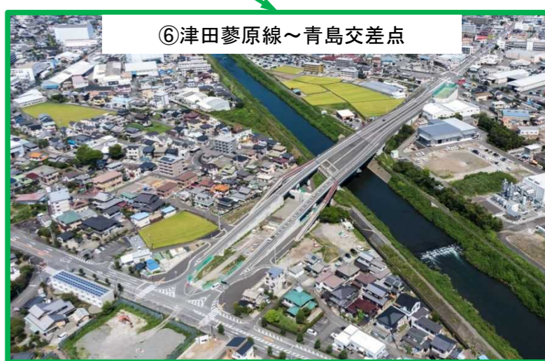
⑥津田蓼原線～青島交差点 平成28年3月供用済