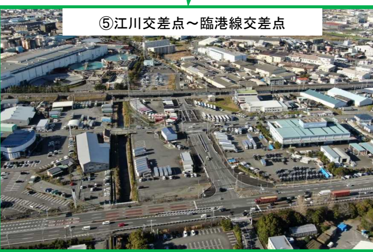
⑤江川交差点～臨港線交差点 平成20年12月供用済