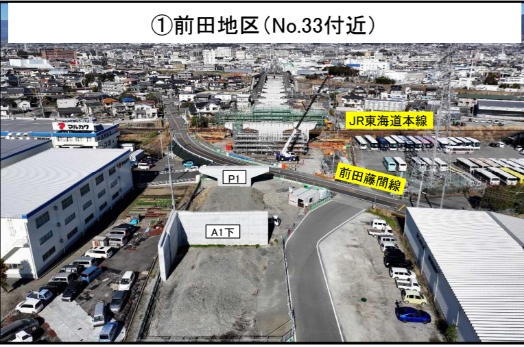
①前田地区(No.33付近) A1橋脚 下り背面L型擁壁 施工完了