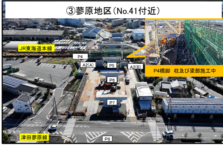
③蓼原地区(No.41付近) P4橋脚 令和5年4月着工