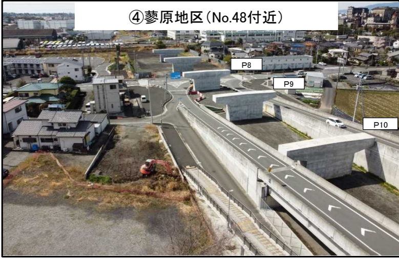
④蓼原地区(No.48付近) P8・P9・P10橋脚 令和4年2月 施工完了