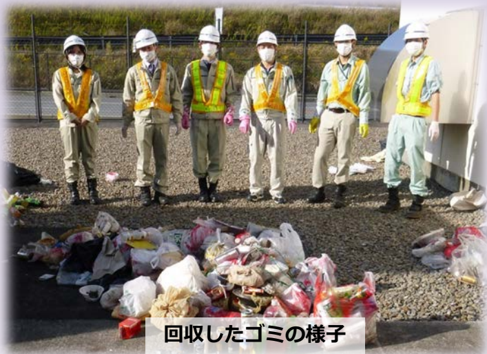
回収したゴミの様子