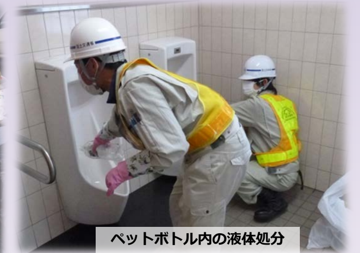
ペットボトル内の液体処分