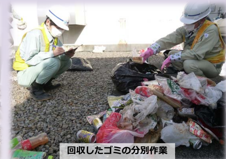
回収したゴミの分別作業