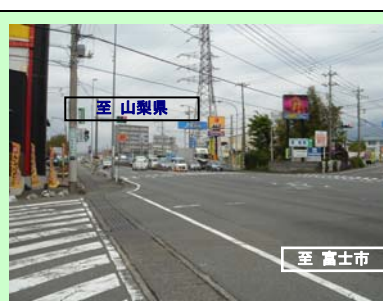
国道139号 登山道入口交差点