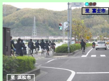
国道1号 静岡地区自転車道設置