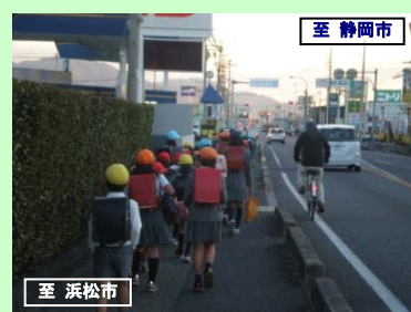
国道1号 青島地区歩道設置

※本プランでは、交通事故対策を効率的に実施していくため、交通死傷事故が多発する箇所や道路利用者・地域の皆様が危険と感じられている箇所を対象にして、優先的に対策を行います。