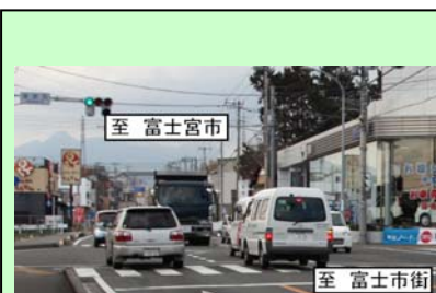
国道139号 厚原西交差点