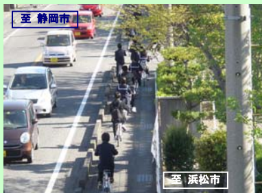
国道1号 水守地区歩道設置