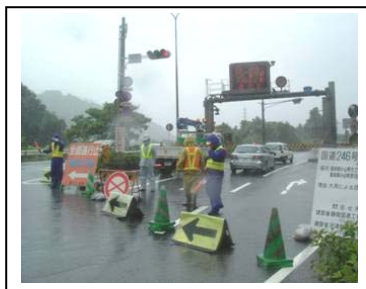
【雨量規制区間の通行規制により二次災害を防ぐ】