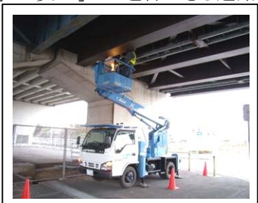
【定期点検により橋梁をきめ細やかに管理】