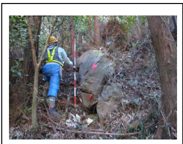
【防災点検により危険箇所の有無を確認】