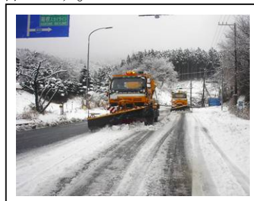
【雪氷作業によりスリップ事故防止を図る】