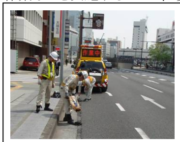
【道路パトロールで発見された道路損傷の復旧】

道路パトロールによる日常的な道路管理のほか、防災点検、橋梁点検など、道路構造物の定期的な点検、雪氷作業などを実施することで、「安全」で「安心」して通行できる道路を確保します。