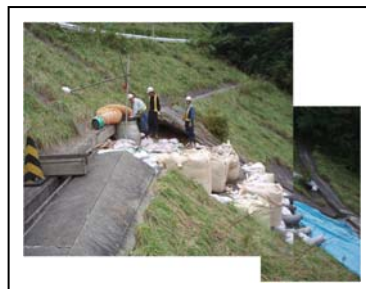
【緊急時も速やかに対応し「安心」「安全」を確保】