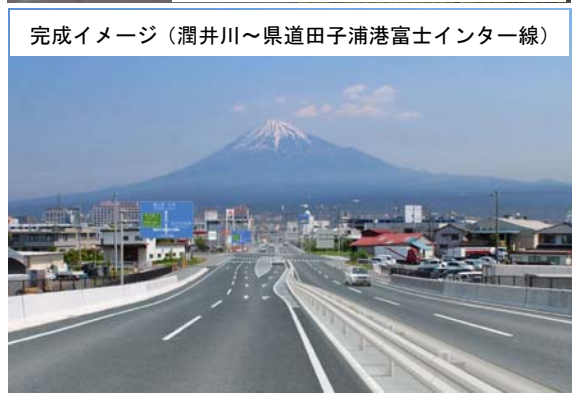
平成 25 年 8 月撮影