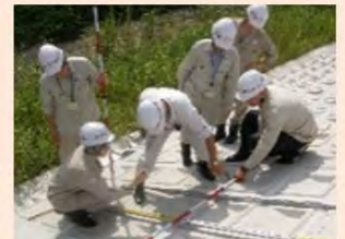
地域における技術者派遣の 仕組みづくりの支援