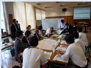
個別施設計画の策定・実施の課題 解決につながるアイデア紹介