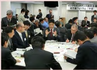
メンテナンスの課題を解決する技術等の紹介や技術マッチング