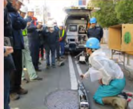
新技術導入の検討の現場試行の調整