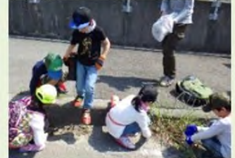
地域一体の取組みへのサポート