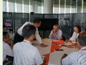
各地の地域によるメンテナンス活動の紹介