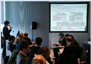
包括的民間委託等の民間活用 の取組み事例の紹介