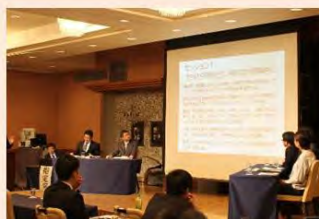
技術者の確保や育成に関する 各地での取組み紹介