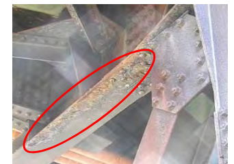
耐候性鋼材に層状の剥離