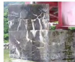
下部工にASRによる劣化が疑われる