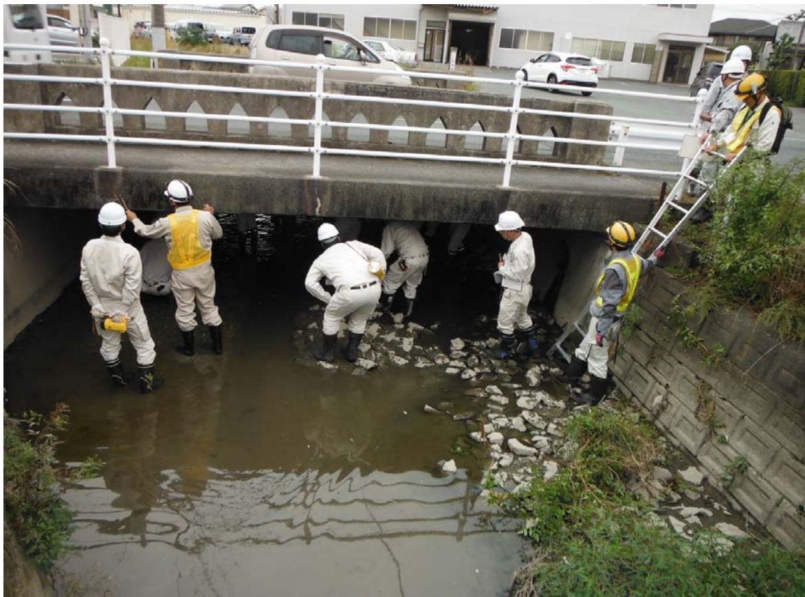
浜松市東区有玉南町にて