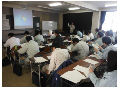
座学を行いました