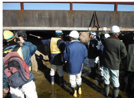
RC橋およびPC橋を近接目視や打音検査の実習しました