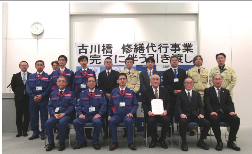
古川橋 修繕代行事業関係者による記念撮影