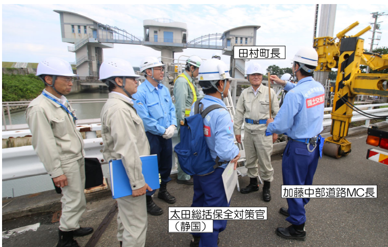
点検状況（概要）を説明中