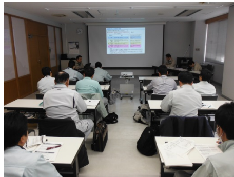
座学を行いました