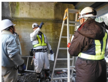
RC橋を近接目視や打音検査の実習しました