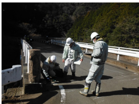
舗装及び防護柵等の点検実習をしました