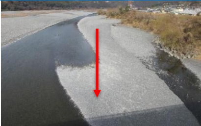
大井川用水水路橋上流(令和8年2月24日)