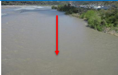
大井川用水水路橋上流(令和8年4月4日)