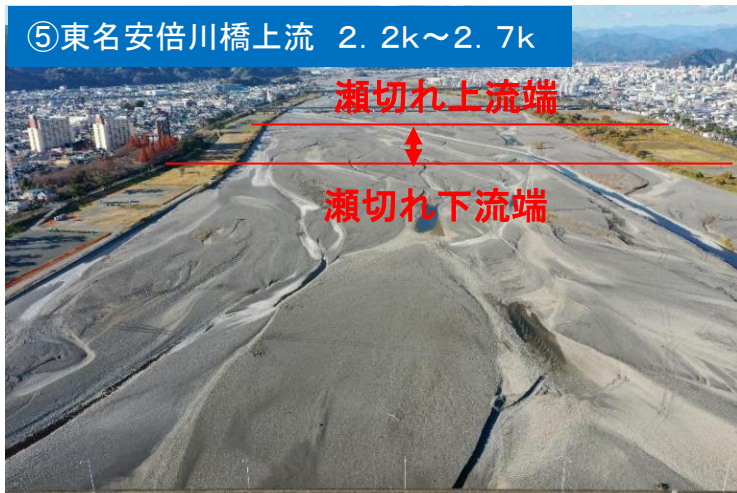
⑤東名安倍川橋上流 2.2k～2.7k