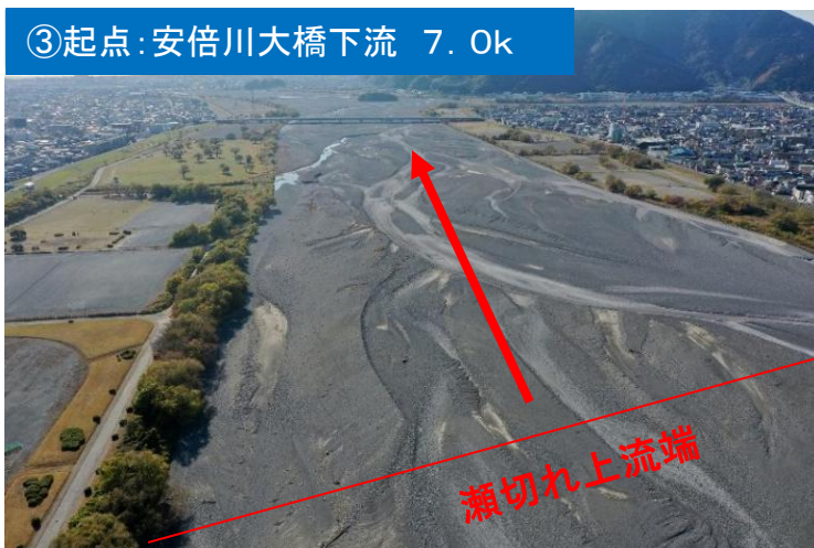
③起点：安倍川大橋下流 7.0k