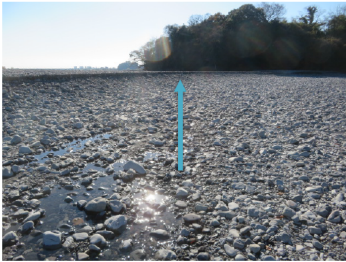
① 安倍川安西橋下流側↑ (令和3年12月21日の様子)

令和3年12月21日現在: 安倍川安西橋(国道362号線)下流側 ・瀬切の発生を確認