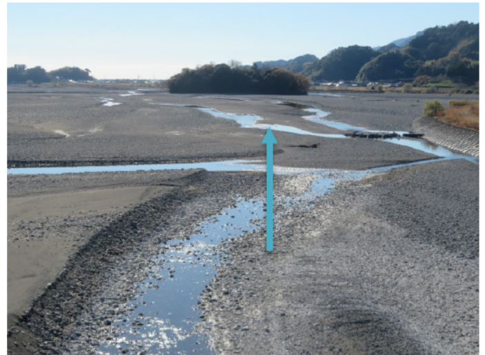
① 安倍川安西橋下流側↑ (令和3年12月17日の様子)