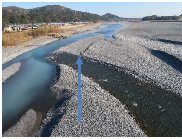
大井川用水水路橋下流側(21.0km付近)(12月24日)