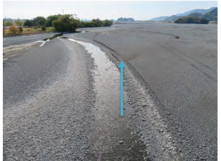
①安倍川安西橋下流側 (令和3年11月19日の様子)