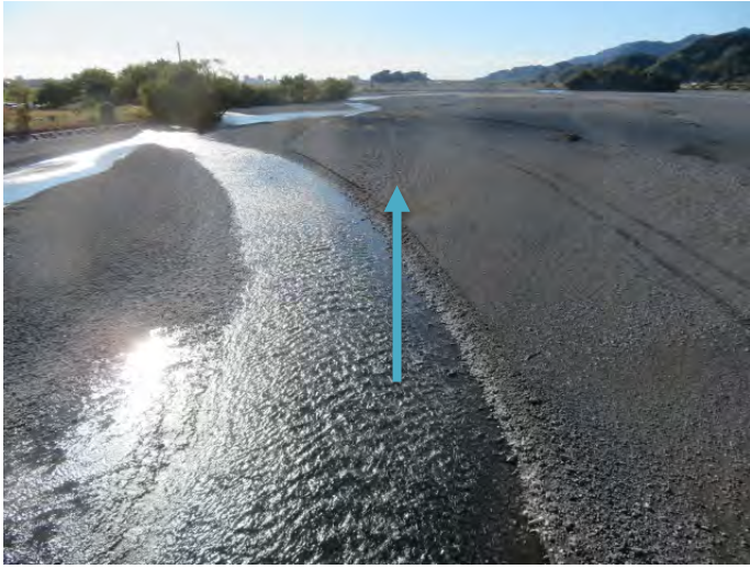
①安倍川安西橋下流側 (令和3年11月24日の様子)

令和3年11月24日現在:安倍川安西橋(国道362号線)下流側 ・瀬切の解消を確認