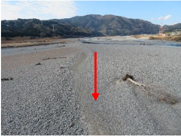
大井川用水水路橋上流側(21.0km付近)(2月1日)