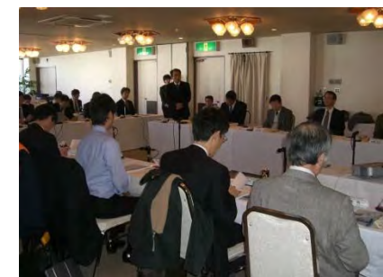
委員会の開催状況