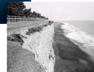
清水海岸の被災状況(H4)

「防災」、「土砂の連続性」の観点では、領域間で連携した流砂系一貫としての総合土砂管理が重要である。