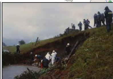
H12.9出水による被災状況(左岸11.75k) S57.8出水による被災状況(左岸12k)