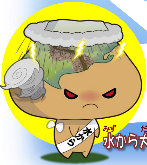
みず たいおう 水から大王

きみ まち おおあめ 君たちの町にも、いつ大雨 が降るか分からないぞ。 ゆだんしないで備えること を忘れるな!