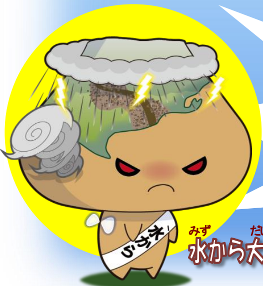
みず たいおう 水から大王