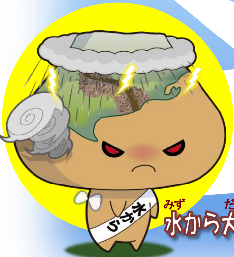
みず たいおう 水から大王

きみ まち おおあめ 君たちの町にも、いつ大雨 が降るか分からないぞ。 ゆだんしないで備えること を忘れるな!