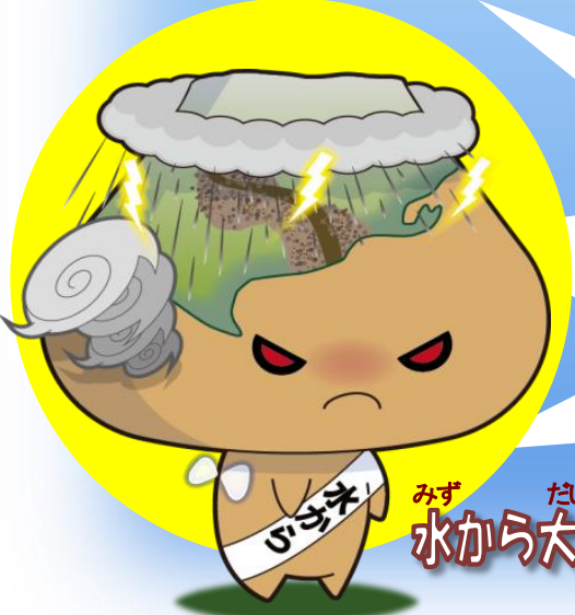
みず たいおう 水から大王