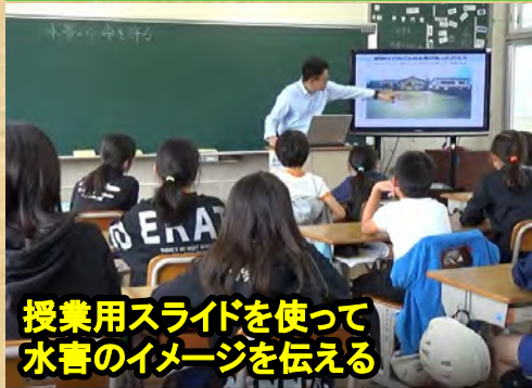
写真や映像教材から 水害がどんなものか知る