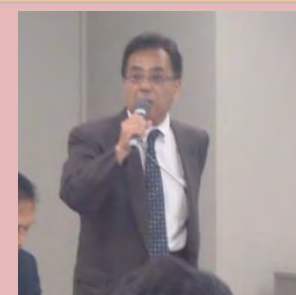
静岡河川事務所長講評