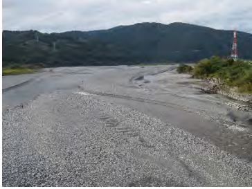
大井川用水水路橋上流(21.0km付近)(10月27日)